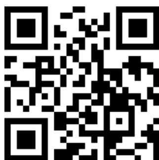
QR Code 條碼報名